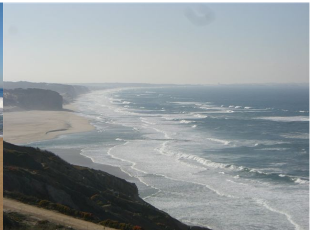
Foz do Arelho

A même distance se trouve le Praia del Gralha, entouré de rocher. Ces roches servent également comme point de départ des parapentes. Les abords de Serra dos Mangues vous invitent à des promenades avec vue splendides sur l'océan Atlantique.